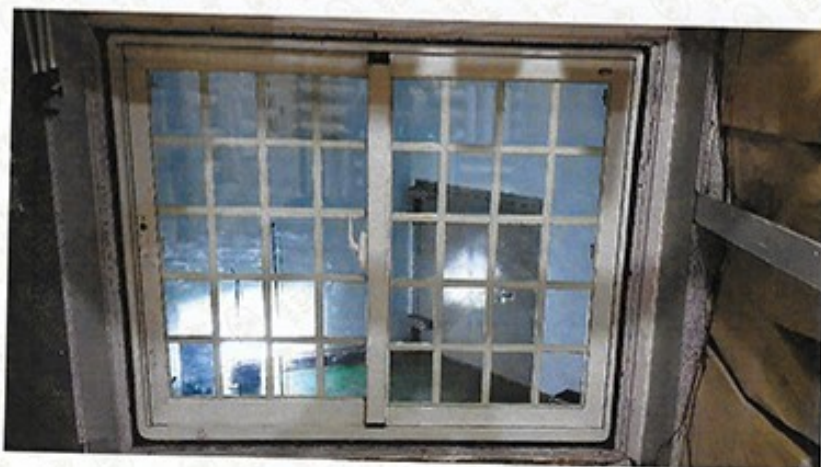
圖 1 試樣佈置圖 (無響室)