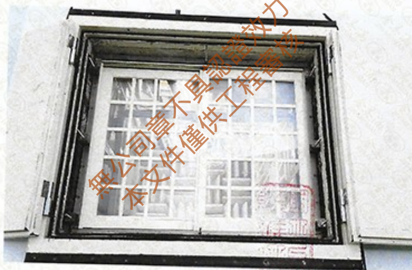
圖 2 試樣佈置圖 (迴響室)