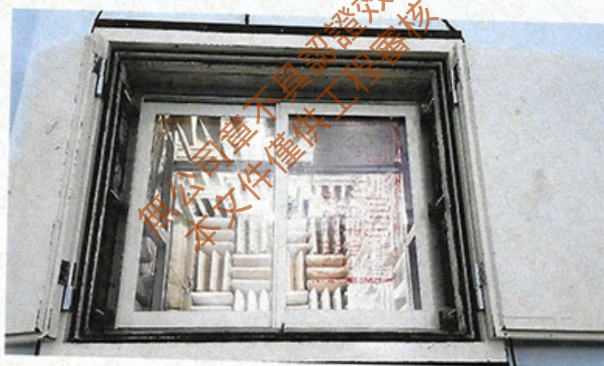
圖 2 試樣佈置圖 (迴響室)