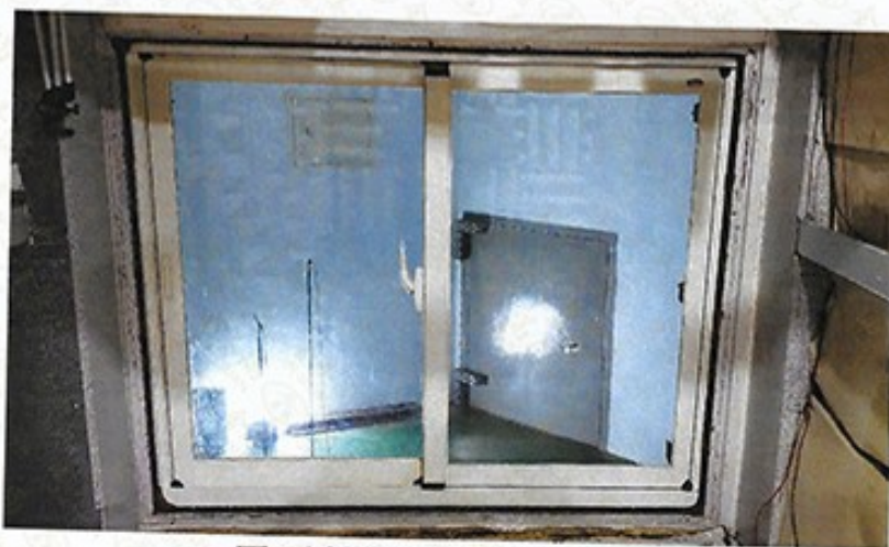
圖 1 試樣佈置圖 (無響室)