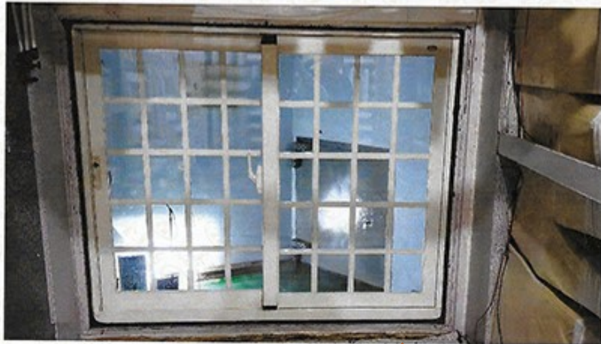
圖 1 試樣佈置圖 (無響室)