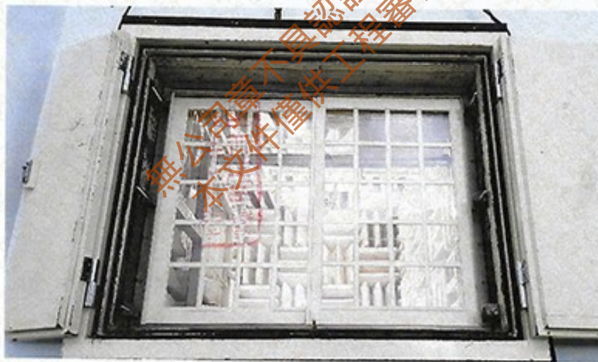
圖 2 試樣佈置圖 (迴響室)