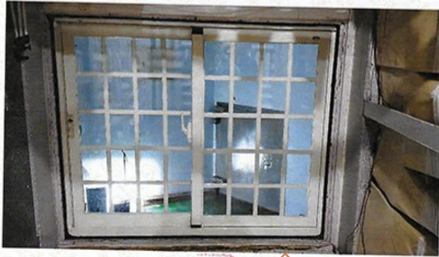
圖 1 試樣佈置圖 (無響室)