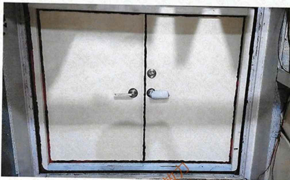
圖 1 試樣佈置圖 (無響室)