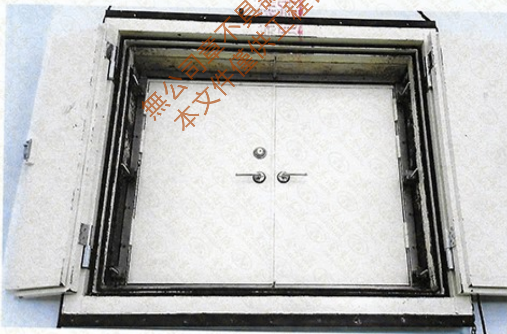
圖 2 試樣佈置圖 (迴響室)