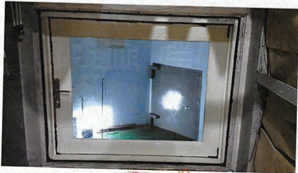
圖 1 試樣佈置圖 (無響室)